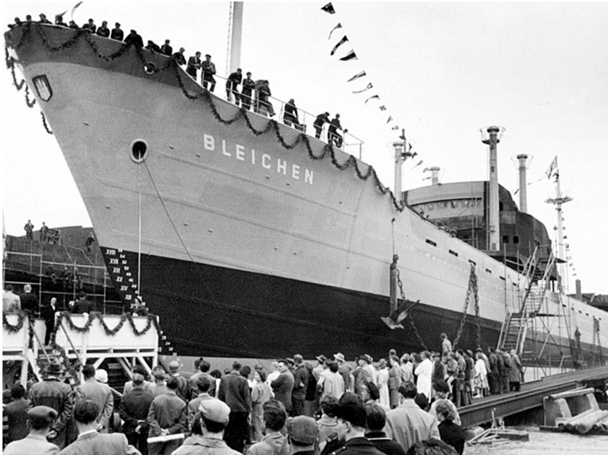
Australiastrasse, Schuppen 52A (Bremer Kai am Hansa Hafen) 20457 Hamburg Veddel